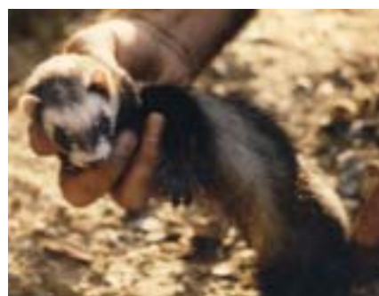
Les communes en surpopulation procèdent à des reprises