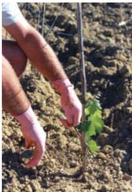
Le répulsif, une solution temporairement efficace pour protéger les cultures