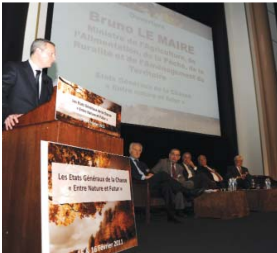
Bruno Le Maire Ministre de l'Agriculture

des nombreuses personnalités politiques venues spécialement ce jour là pour en prendre connaissance.