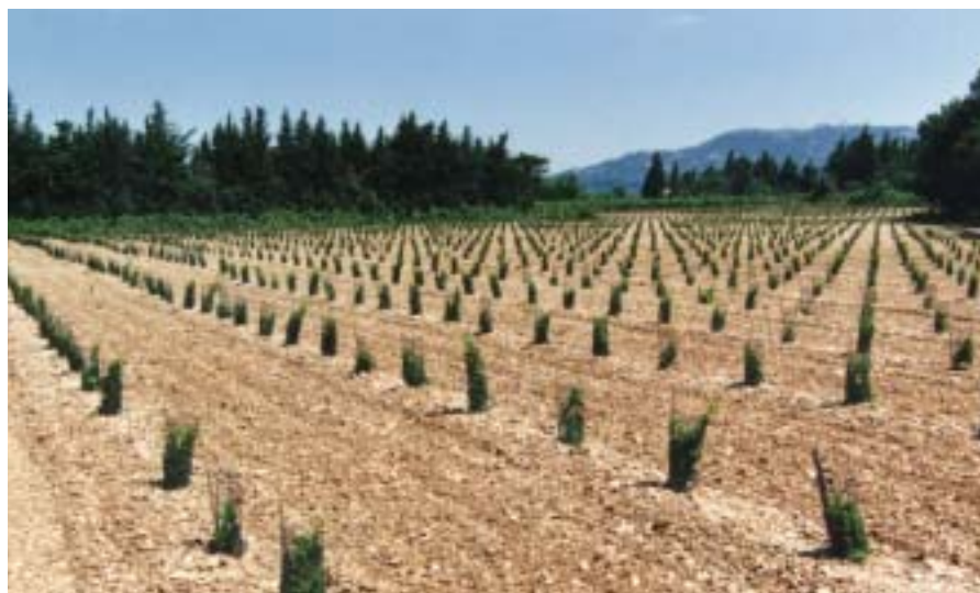
La protection individuelle des ceps de vigne, une solution plus durable

Secundo, les sociétés de chasse désireuses de repeupler leur territoire avec ces animaux, cédés gratuitement ou en échange de la participation aux reprises, doivent en faire la demande, par écrit, auprès du service technique fédéral. La