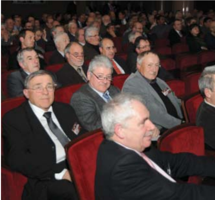
Plus de 400 responsables cynégétiques avaient fait le déplacement. Ici la délégation de l'Hérault

débats, qui eux mêmes devaient aboutir à un plan d'action sur le long terme.