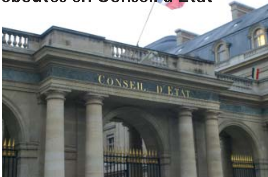
Par ordonnance en date du 28 janvier 2011, le Conseil d'Etat a déclaré irrecevables les requêtes de FNE, LPO, ROC et ASPAS.

Confirmation du 10 février pour les oies Mais cette fois, les choses n'ont pas tourné à leur avantage. Le Conseil d'Etat a débouté la « bande des quatre » qui demandait une fermeture non pas au 31 janvier, mais au 20 janvier. Cette ordonnance, quasi historique, inflige un camouflet sans précédent à ces groupuscules qui s'érigent contre la liberté de chasser, n'hésitant pas pour cela à renier les accords passés lors des tables rondes de la chasse.