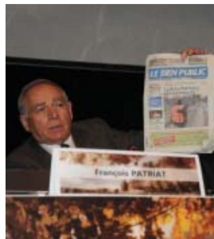
François Patriat, ancien Ministre

Depuis 20 ans, la société française et sa vision de la biodiversité ont grandement évolué. Le concept même de « biodiversité » était en quelque sorte inconnu en 1990 :