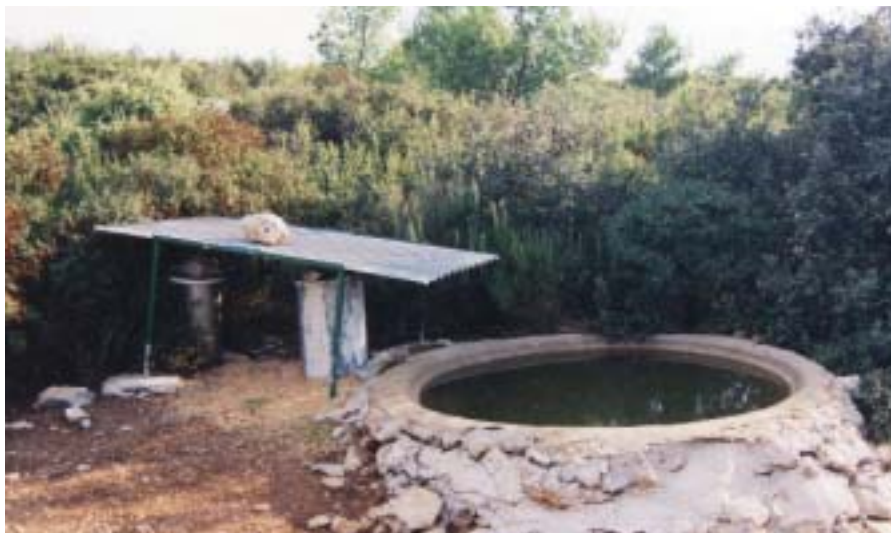
Les aménagements cynégétiques seront encouragés

Parmi les critères d'évaluation, seront appréciés les efforts de formation des chasseurs, la sécurité des chasseurs et des non chasseurs, le partage organisé du gibier auprès des chasseurs mais également des non chasseurs, l'accueil des nouveaux chasseurs, la diversification des modes de chasse, le recrutement de nouveaux chasseurs, le maintien de l'équilibre agro-sylvo-cynégétique avec les acteurs agricoles et forestiers, l'aménagement des territoires de chasse. La durabilité des prélèvements et les actions de réhabilitation et d'entretien des milieux naturels en faveur de la faune sauvage seront un point essentiel du dossier. In fine, la mise en place d'échanges avec les non chasseurs et d'actions d'information, de