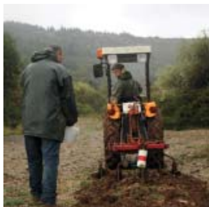
Au printemps, ces terres labourées et enssemées par les chasseurs assureront le gîte et le couvert pour le petit gibier sédentaire.

La richesse humaine, comme toujours, c'est le maître mot dans les sociétés de chasse qui tournent bien. Ainsi, deux gardes particuliers s'emploient notamment à faire respecter les quotas de prélèvement et les abords des maisons, et quatre piégeurs actifs à réguler les prédateurs, notamment les pies, qui pullulent sur le territoire.