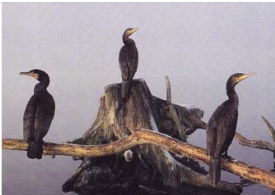
Imposant oiseau noir aux reflets métallisés, le grand cormoran n'est pas un oiseau de haute mer. Il vit à proximité des terres, rivages marins, berges d'eaux douces et capture du poisson en plongeant.

Pour la saison 2010-2011, les quotas de régulation du grand cormoran ont été fixés par arrêté ministériel du 26 novembre 2010, publié au Journal Officiel du 12 décembre 2010 : 360 pour le département de l'Hérault. Un nombre qui paraît vraiment modeste compte tenu de l'explosion démographique enregistrée sur cette espèce depuis plusieurs décennies.