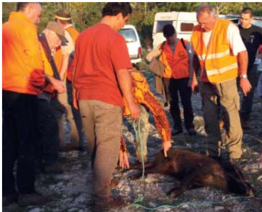
Tout ce qui a été en contact avec des animaux atteints devient contagieux.

La Bulgarie est actuellement en train de procéder aux abattages sanitaires dans les élevages de la zone contaminée. La proximité de la frontière turque, que les sangliers peuvent traverser sans difficulté, est considérée par les autorités bulgares comme un élément d'explication pour ce foyer.