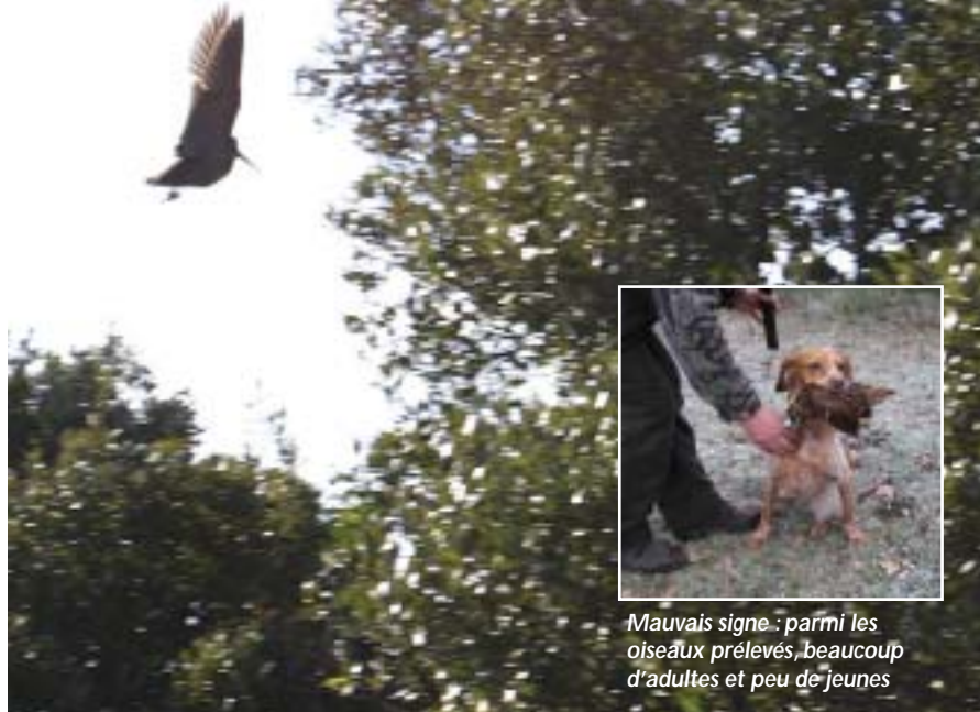
Mauvais signe : parmi les oiseaux prélevés, beaucoup d'adultes et peu de jeunes

Face à un tel constat, le ministère demandait aux préfets « d'organiser rapidement une concertation avec la fédération des chasseurs de votre département afin d'étudier le moyen le plus adapté pour diminuer la pression de chasse sur la bécasse des bois. » Cette lettre du ministère, envoyé à tous les préfets de France, fixait ensuite explicitement la feuille de route aux représentants de l'Etat : « vous disposez d'un certain nombre d'outils mobilisables ou adaptables rapidement : en réduisant les quotas dans le cadre du PMA départemental ou plan de gestion cynégétique s'ils existent (...) ou en modulant la pression de chasse