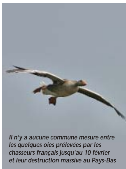
Il n'y a aucune commune mesure entre les quelques oies prélevées par les chasseurs français jusqu'au 10 février et leur destruction massive au Pays-Bas

F rance Nature Environnement (FNE), le Rassemblement des Opposants à la Chasse (ROC), la Ligue de Protection des Oiseaux (LPO) et l'Association pour la Protection des Animaux Sauvages (ASPAS) ont finalement réussi à se mettre d'accord pour contester ensemble la seule « concession » faite aux chasseurs lors de la dernière Table Ronde de la chasse : la fermeture de la chasse aux oies fixée au 10 février. Voilà qui démontre une fois de plus la mauvaise foi de ces gens-là, l'impossibilité de négocier quoi que ce soit avec eux et leur acharnement aveugle contre la chasse et les chasseurs.